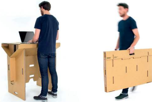
Figura 15: Escritorio de pie de Refold en uso y durante su transporte