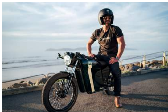
Figura 11: FTN Motion Streetdog de 2021