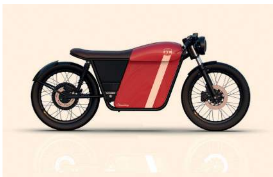
Figura 13: Renderizado CAD de la FTN Motion Streetdog