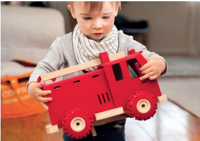
Figura 9: Brave Dave™