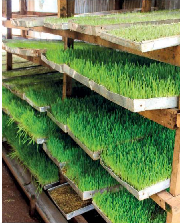
Figura 7: Bandeja de forraje de Hydroponics Africa