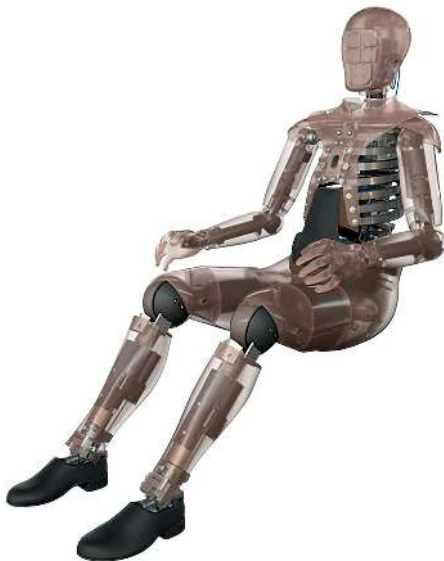
Figura 4: Un maniquí de pruebas de choque es un ejemplo de modelo físico instrumentado