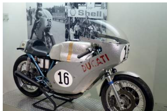
Figura 12: Ducati Desmo Racer de 1972